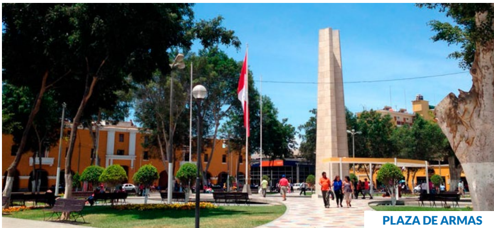
PLAZA DE ARMAS